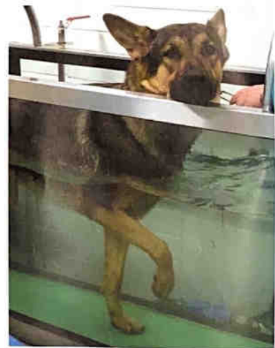
Vesiterapia on tehokasta.

Yritys tarjoaa perushoitojen lisäksi myös eläinlääkärin, koiratrimmaajan ja eläinten kouluttajan palveluita sekä tekee yhteistyötä usean eläinklinikan, ortopedin, eläinfyysioterapeutin ja osteopaatin kanssa. Yritys järjestää myös erilaisia kursseja käyttäytymisestä ja hyvinvoinnista.